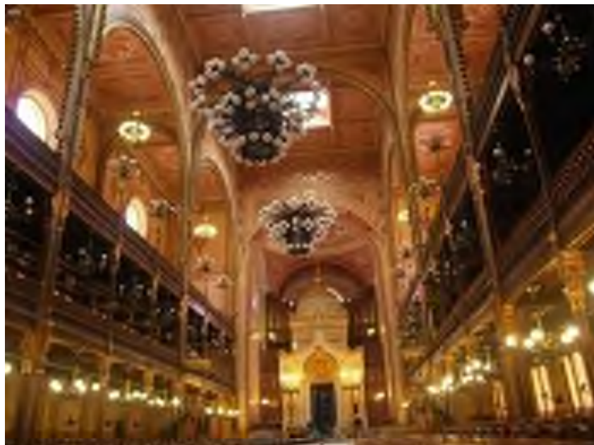
Binnenzicht Dogane synagogue Boedapest.

Men heeft dat vooral op een zeer mooie, meestal in een luxueuse en artistieke manier gebouwd; uit marmer of gesneden hout, verguld in alle mogelijke stijlen zoals de Moorse stijl, met een koepel verbonden barok, gotisch enz... Sommige van de mooiste "Aron Ha'Kodeshen" heeft men van uitstervende gemeenten naar Israël overgebracht. Enkele voorbeelden zijn: de "Aron Ha'kodesh" uit Italië, die zich nu in het Israël-museum bevindt; en de "Aron Ha'kodesh" uit Padova die zich vandaag in de hoofdzaal van de Yeshiva Ponoviz in Bnei Brak bevindt en een echte bezienswaardigheid is.