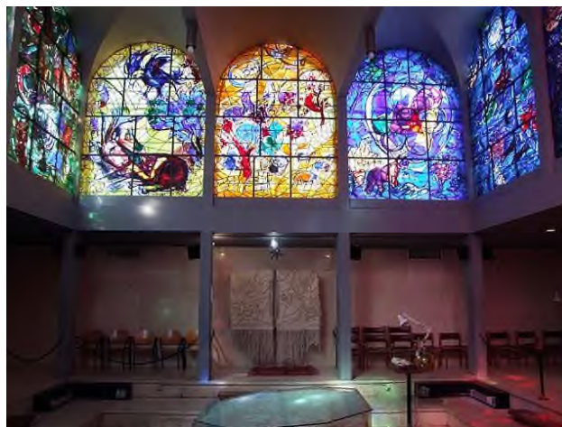
Chagall vitrage in de synage van het Hadassah hospitaal van Jeruzalem. Het thema zijn de twaalf stammen van Israel. Elke stam heeft een venster.

Gewoonlijk heeft elke Synagoge-bidder een vaste plaats. 's Nachts werden kaarsen aangestoken, verder waren vele vensters voorzien zodat overdag ook voldoende licht aanwezig was. Verbondenheid met de buitenwereld is het achterliggende idee. Veelal was er ook een herberg naast de Synagoge voor daklozen en armen, om te eten en te slapen. De Synagoge was ook 24 uur op 24 uur open voor iedereen en was de natuurlijke samenkomstplaats van Joden op elk tijdstip van de dag; s'morgens, s'middags en s'avonds.