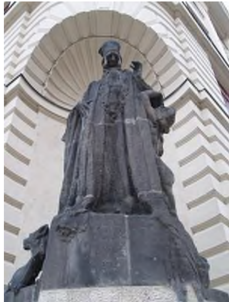
Standbeeld van Rabbi Löw in Praag