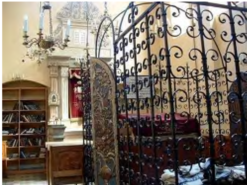
De beroemde Rema-synagoge van Krakau, 17 de eeuw. De enige synagoge die buiten rondom een Joods kerkhof heeft. Hier werkte en leefde Rabbi Moshe Isserlis, de grootste Ashkenazische autoriteit op het gebied van Halacha in de nieuwe tijd.

Joodse mannelijke kinderen onder de "Bar Mitsva" leeftijd als ook Joodse vrouwen tellen niet mee voor de minjan omdat zij Halachisch streng genomen niet verplicht zijn om regelmatig aan de diensten deel te nemen. Dit is geen discriminatie van de vrouwen. De Rabbijnen hebben de vrouwen vrijgesteld van regelmatig bezoek van de Synagoge door hun bijzondere rol als gezinshoofd in de opvoeding van de kinderen en verzorging van het gezin. Maar vrouwen zijn niet vrijgesteld van de plicht om te bidden. Ze moeten bidden maar niet op vaste tijdstippen, tijdstippen bepalen ze zelf.