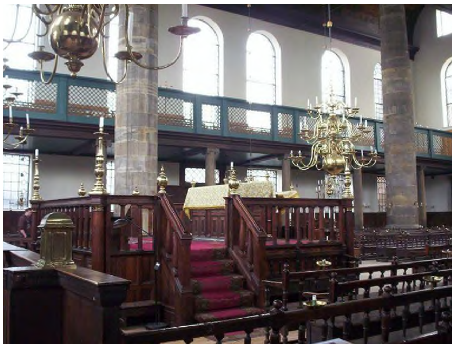
De beroemdste bima ter wereld van de Esnoga Synagoge Amsterdam. De bima bevindt zich aan de achterkant van de synagoge en was de gewone plaats van de Chazan. Voor de bima was de plaats waar de parnassim zaten.

In het Beit HaMikdash was het altaar centraal gelegen, en zo heeft ook de halacha gevraagd om de bima centraal in de synagoge te plaatsen om aan het idee tegemoet te komen dat de synagoge een tempel in miniatuur is. Bovendien heeft het Torahgetrouwe Jodendom de Bima dicht voor de Ahron Hakodesh als imitatie van het christendom gezien die het altaar vooraan plaatsen.