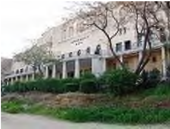
buitenzicht Ponovitch Yeshiva Bnei Brak

Meer als 1000 mensen nemen er deel aan de religieuze diensten. Ook in Antwerpen zijn 3 bidlokalen die de "Yeshiva" traditie volgen en de diensten, Torah-lezing en voordrachten over de wekelijkse Sidra gestalte geven.