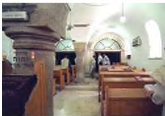
Inside The Ramban Synagogue

Na de bevrijding van de oude stad Jeruzalem in 1967, heeft de Israëliische regering in samenwerking met het Israëliische gezelschap voor de restauratie van gebouwen en monumenten, vele van deze Synagogen in hun originele bouw gereconstrueerd, waaronder ook de Synagoge van Nachmanides.