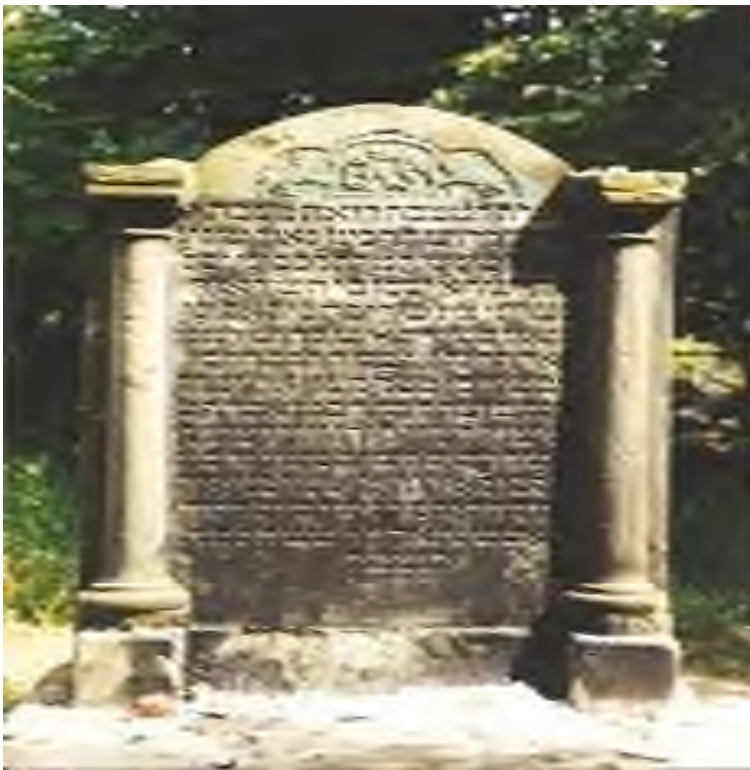
grave of rabbi yitzhak yaakov horowitz known as "The Chozeh of Lublin". (1745 - August 15, 1815)

De 'maranen' uit Spanje en Portugal hebben na hun succesvolle aankomst in West-Europa, vnl. in Nederland en Engeland zeer indrukwekkende Synagogen gebouwd.