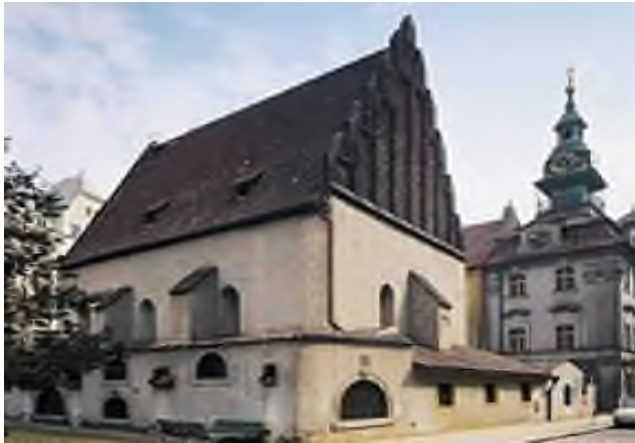
Alt-neu – synagoge Praag

De 'Alt-Neu sjoel' in Praag heeft een bijzonder magische klank voor historische Joodse geschiedeniskenners. Ze werd gesticht in de 13 de eeuw en bestaat nog tot op heden. Er zijn regelmatig diensten op 'Sjabbat', feestdagen en werkdagen.