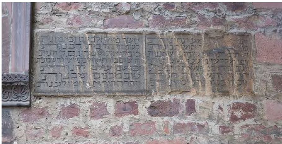
Originele stichtingstafel van de Synagoge te Worms, meer als een millenium oud.

De namen van deze schenkers werden vereeuwigd in de Synagoge, dit ter herinnering voor de volgende generaties en als voorbeeld voor het Joodse volk. Meest bekende voorbeelden zijn de originele stichtingstafel van de Rashi Synagoge in Worms waar de schenkers uitdrukkelijk staan; Ook de pinkus Synagoge in Praag heeft een stichtingstafel met de naam van de weldoeners.