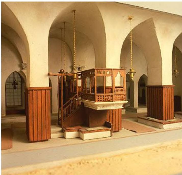
Aleppo Synagoge, Syrië.

De familie 'Ben Asjeer' (8 ste eeuw Tiberias) is hier verantwoordelijk voor. Maimonides heeft in zijn halachot opgenomen hoe een Torah-rol geschreven moet zijn, en richtte zich hierbij op dit manuscript. Het manuscript werd van de 13 de eeuw tot 1947 in de Synagoge van Aleppo bewaard en bewonderd. Arabische vandalen en fundamentalisten hebben de Synagoge in brand gestoken waarbij ook dit "keter"-manuscript spijtig genoeg beschadigd werd. Door een wonder kon een deel wel gered worden en bevindt zich nu in het Israël-museum te Jeruzalem. Zijn waarde is onschatbaar.