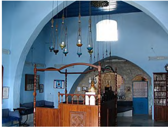
De 'Rabbi Josef Karo-Synagoge' te Safed, Israël

de Talmoedische tradities waren in Jeruzalem 480 Synagogen voor de vernietiging van de tweede Tempel. Tegelijk bestonden dus met de Tempel ook Synagogen.