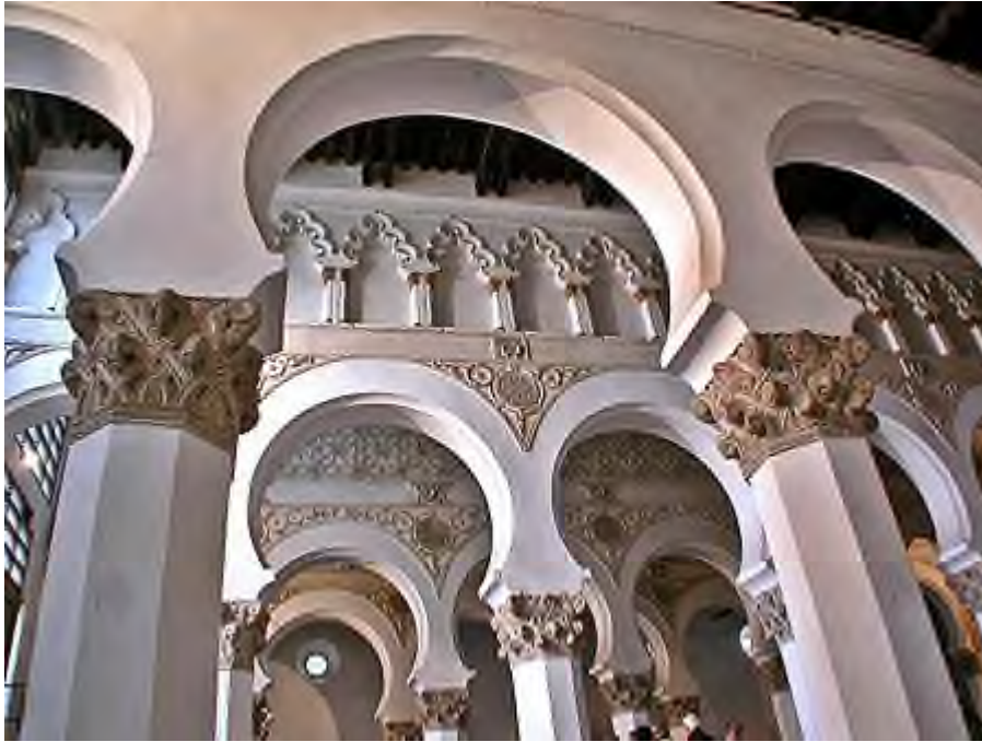
El Transito – Synagoge

Voor WO II diende deze Synagoge als een katholieke kerk. Na de Shoah heeft de Spaanse regering dit aan de Joden teruggegeven; zij hebben er een Joods museum van gemaakt, omdat er niet genoeg Joden meer waren in Toledo. Misschien is het ook daarom dat de Joden na de verdrijving spraken van Toledo-no.