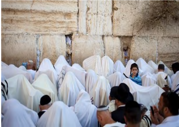
Priesterzegen aan de Kotel op Pesach, Shavuot en Soekot, waar velen uit heel Israel samenkomen om hier de priesterzegen te ontvangen.

In elke Synagoge was ook een verhoging vanwaar de priesters 'Cohanim' aan het volk de priesterzegen gaven. In de beginperiode van de Synagoge zaten de mensen op tapijten, sofa's of op kussens en ingebouwde steen-banken.