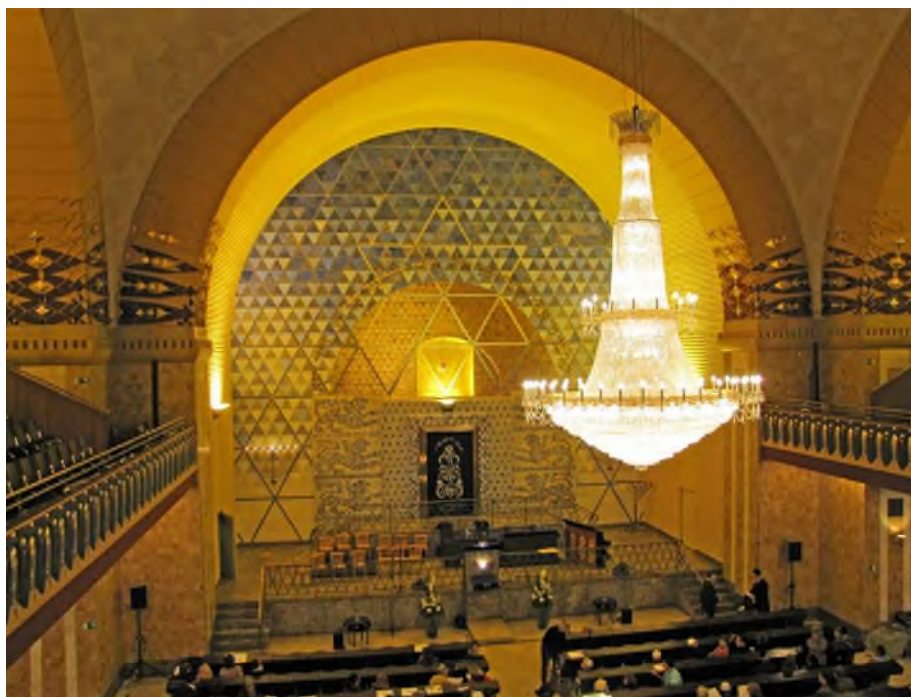
Interieur Westend-synagoge, gebouwd 1907 als liberale synagogue. Tijdens de Shoah werd ze vanbinnen door de nazi's verwoest op Kristalnacht (9 november 1938). De buitenfacade is blijven staan, omdat ze zich bevond in het midden van een woonblok. Na de Shoah heeft men met middelen van de Duitse overheid de synagoge deels hersteld, deels gereconstrueerd, en vandaag is dit een Einheits-synagoge, dit betekent dat de diensten volgens de orthodoxe halachische gevolgenheid uitgevoerd worden, hoewel dit geen reflectie is van de religieuziteit van de leden van de synagoge.