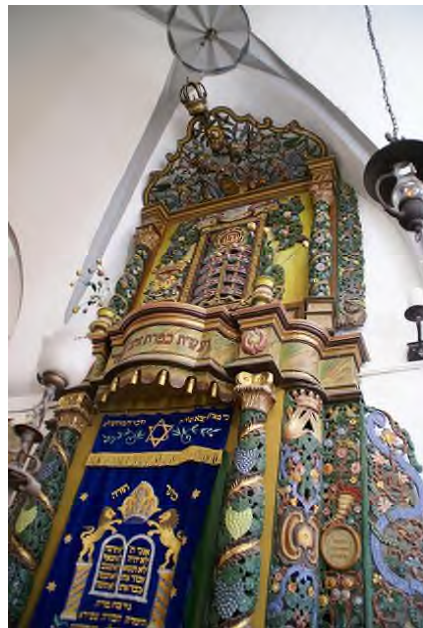
De 'Aron HaKodesh' van de Ari-Synagoge in Safed