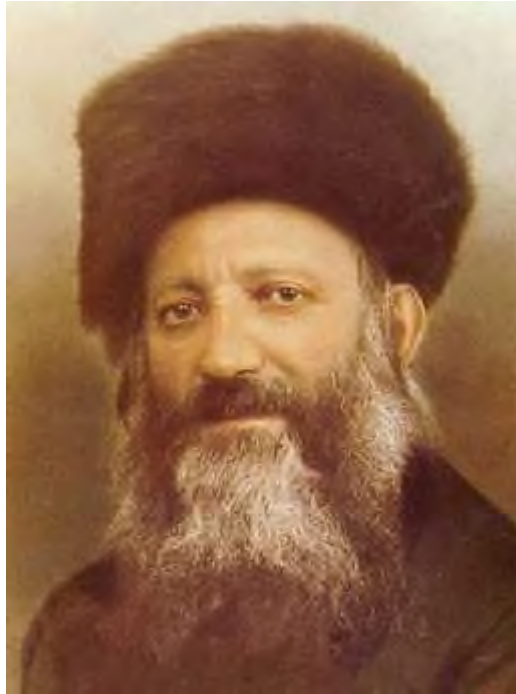
Rabbin Avraham Jitschak Kook

Kook (1865–1935) de eerste Ashkenazische Rabbijn van het toenmalig Palestina gezegd; 'Er zijn mensen met een hart van steen en er zijn stenen met een hart van een mens.'