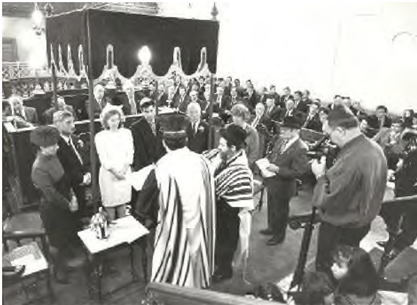
Joods huwelijk in Zwolle, Nl 19de eeuw

Tenslotte kan men algemeen zeggen dat de verhouding van kerk tegenover de Synagoge in de middeleeuwen gekarakteriseerd was door verdrijvingen van Joden, vernietigingen en zeer vaak bouwde men Synagogen om tot kerken. De Islam heeft in de Middeleeuwen algemeen een meer tolerante houding tegenover de Synagoge getoond.