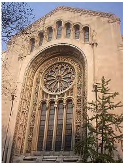
Tempel Emanu – El, New York – de bekendste reform-synagoge van Amerika.