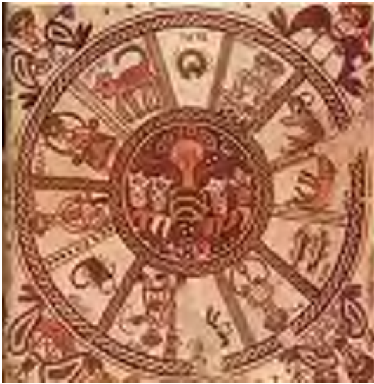
De vloer van de Beth Alfa synagoge naast Jericho.