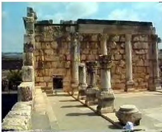
Historische Synagoge Kafarnaüm, Galilea