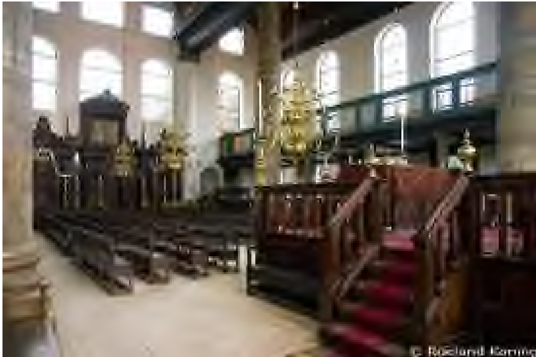
Binnenzicht van de Portugese Synagoge 'Esnoga' te Amsterdam.