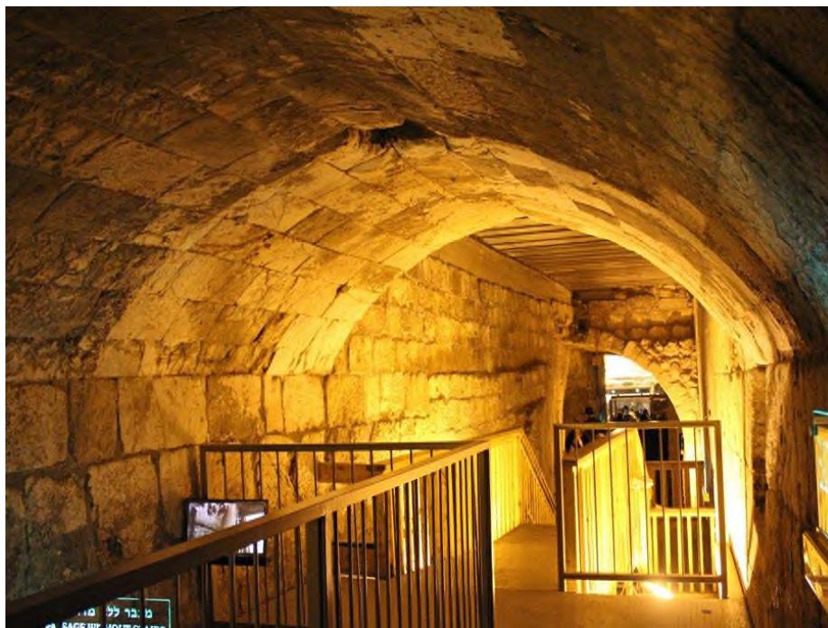
De tunnel-synagoge; een trekpleister voor Joden en andersgelovigen.

Ongeacht dat zijn optreden de comotie van een tweede intifada in gang zette bleef Aryel Sharon altijd overtuigd dat handelen corect was om souvereiniteit over de Tempelberg te tonen. De getrouwen van de Tempel bezoeken regelmatig de Tempelberg om daar hun gebeden te richten en laten zich niet door de Palestijnse, meestal anti-semitische 'vakaf' (beheerders van de moskeën) intimideren. De kotel is de dichtste plek van het allerheiligste die vroeger ook in het Westen lag en waar zich de rots bevond. De laatste veertig jaar ontdekte men nog delen van de Kotel. Daarnaast zijn er nog vele archeologische vondsten die het historische recht van het Joodse volk op deze plaatsen aantonen; zoals onder andere muntstukken, voorwerpen uit de eerste Tempelperiode, enz. Verder is er ook een tunnel naast de Kotel ontdekt, die volgens geruchten als Kabbalistische synagoge dient. Vele toeristen bezoeken deze religieuze tunnelsynagoge. Binnenin is er een gebedsorde, worden er tefillin gelegd enz.