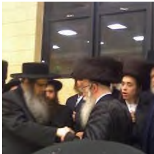
Opperrabbijn, Rabbi Ahron Schiff, begroet de pshevorske Rebbe, shlita