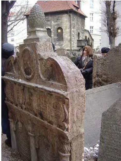
Graf van Maharal, Rabbi Jehoeda Löw

Synagogen en Joodse cultuur onderworpen en vernietigd heeft in een meer van bloed en Asse.