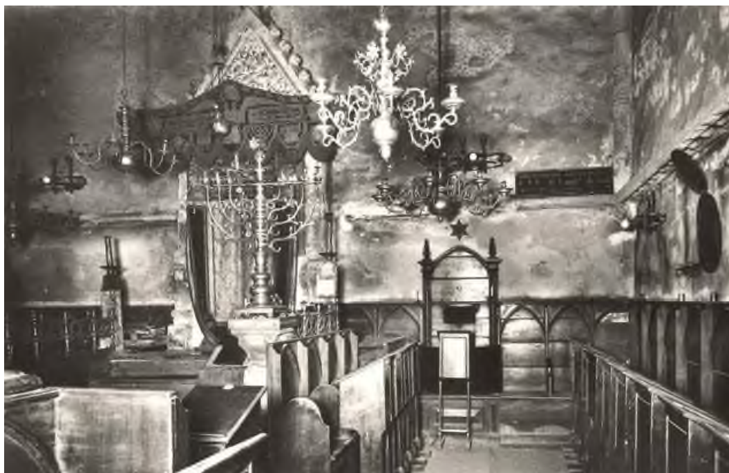
Binnenzicht van de Alt-Nue synagogue te Praag, de grote stoel zou volgens overlevering van de Maharal van Praag zijn.

De zitorde in de Synagoge tijdens de 'Misjna'- en de Talmoedische tijd, was dat ouderen en mensen van aanzien zoals de Rabbijn, 'Chazan', voorzitter van de gemeente,.. op de eerste rij zaten, links en rechts van de 'Aron Ha'Kodesj' ('heilige Ark'), met hun rug gericht naar de 'Aron Ha'Kodesj' en het gezicht naar de mensen toe ( Vergelijkbaar met de beroemde Alt-neu Synagoge in Praag die de zelfde zitorde volgt).