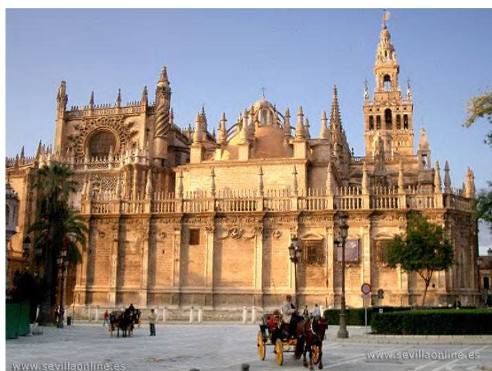
De Kathedraal van Sevilla, Andalusië; voormalige Synagoge die vandaag als kerk dienst doet.

Volgens mijn informatie is de kathedraal van de Joodse buurt in Parijs (Saint-Paul) ook omgevormd geweest vanuit een synagoge, die behoorde tot Rabbi Yechiël van Parijs (13 de eeuw) waar hij zijn yeshivah had met 300 leerlingen. Binnen deze kerk bevindt zich het mikwe van deze beroemde Rabbijn.