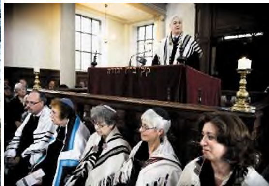
Liberaal Joodse gemeente – dienst op Shabbat in de lvg: geen scheiding tussen mannen en vrouwen; vrouwen met tallit en kipa.